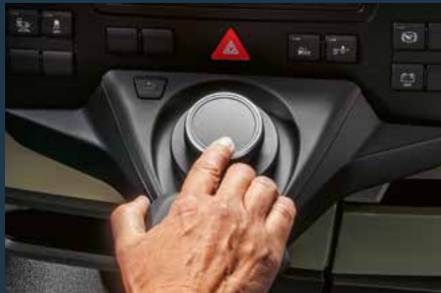
Innovativer MAN SmartSelect zur Bedienung der Multimediasysteme.

Dieser wird in beiden Fahrzeugen perfekt genutzt, um Stauraum und Ablagen zu integrieren, die die Ordnung im Fahrerhaus vereinfachen. Seien es die Dachablagen über der Frontscheibe oder die verschiedenen Ablagemöglichkeiten im Mittelbereich oder am Beifahrersitz.