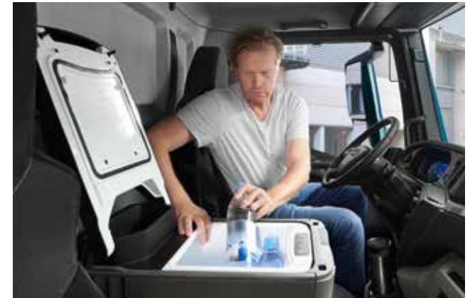
Optimal für Selbstversorger: Kühlbox/-schrank an Bord.

Dabei funktioniert die elektrische Standklimaanlage ohne Kältespeicher, der während des Fahrbetriebs aufgeladen werden müsste, und ist somit jederzeit einsatzbereit. Selbst im Sommer hält sie bis zu elf Stunden angenehm kühl. Während der Fahrt sorgt übrigens die MAN Climatronic für eine vollautomatische Regelung Ihrer gewünschten Temperatur. Auch eine angenehme Temperaturschichtung im Fahrerhaus ist gesichert, da Fußraum und Kopfbereich gesondert geregelt werden. Perfekt für kühle Köpfe und warme Füße. Lärm und Licht müssen allerdings draußen bleiben.