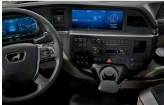
Infotainmentsystem mit 12-Zoll-Display und MAN SmartSelect

Gesteuert wird entweder über ein klassisches Bedienfeld mit Tasten oder mittels MAN SmartSelect (kombinierbar ab Variante Advanced 7 Zoll). Dabei trifft vertraute Handhabung auf innovativen Komfort. Das Ergebnis kann sich sehen und fühlen lassen, denn die hochwertigen Oberflächen bieten bei jeder Fahrt mit den neuen MAN TGM und TGL eine besondere Haptik.