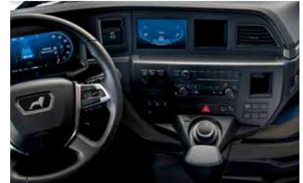
Infotainmentsystem mit 7-Zoll-Display und MAN SmartSelect