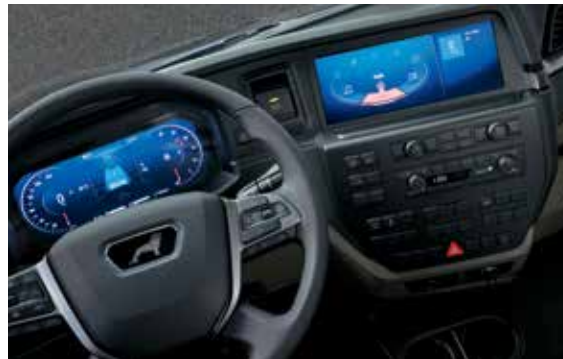
Infotainmentsystem mit 12,3-Zoll-Display und Bedienfeld unterhalb des Sekundärdisplays