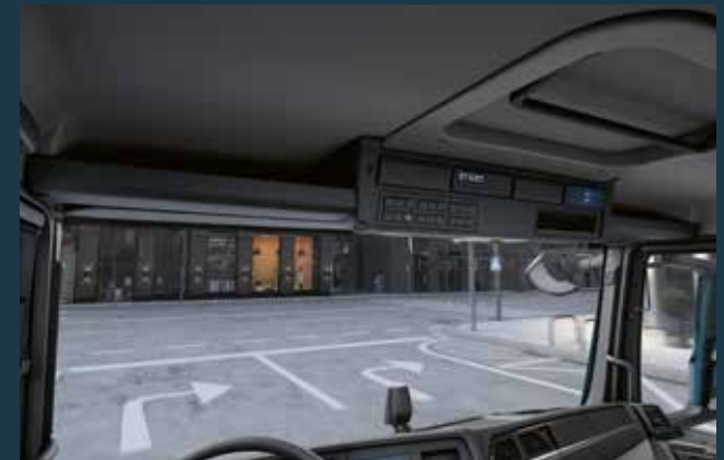
In den beiden offenen geräumigen Ablagefächern über der Windschutzscheibe lassen sich Gegenstände unterbringen, die schnell erreichbar sein müssen.

Je nach Fahrerhaus sind diese, ebenso wie Kühlschrank und weitere Schubladen, in unterschiedlichen Größen vorhanden. So ist die Kabine immer perfekt auf die unterschiedlichen Bedürfnisse der Fahrer ausgerichtet.