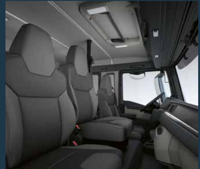
Zweiter Beifahrersitz für die MAN-Doppelkabine.

Die Doppelkabine verfügt aber nicht nur über innere Werte: Die elegante Front präsentiert sich ganz im Look der neuen MAN TG Fahrzeuge. Aerodynamische Optimierungen minimieren den Kraftstoffverbrauch und erhöhen die Wirtschaftlichkeit.