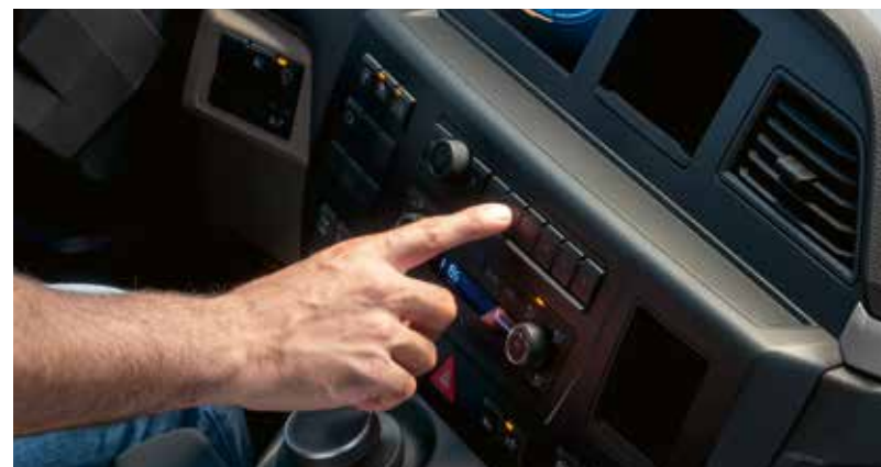
Frei belegbare Direkteinstiegstasten mit Berührungssensor.

Das Beste aus Theorie und Praxis: Im Bedienkonzept der neuen MAN TGM und TGL treffen sich neueste wissen- schaftliche Erkenntnisse und Ergebnisse intensiver Praxistests mit Fahrern.