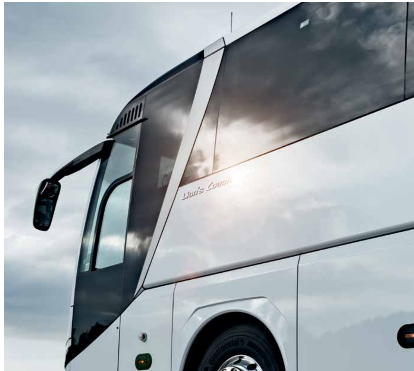
So schön ist Sicherheit: Die patentierte MAN-Gerippe-Konstruktion erfüllt ECE-R66.02