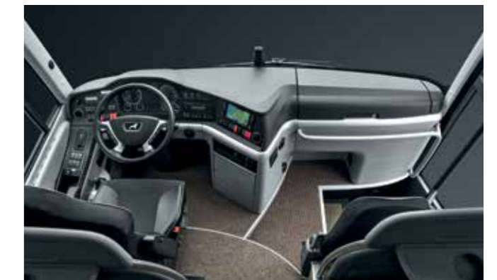
Attraktive Form- und Farbgebung