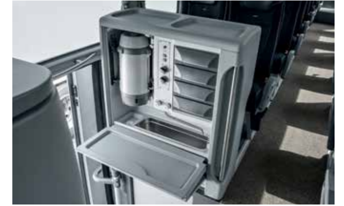
Moderne Podestküche für zufriedene Gäste