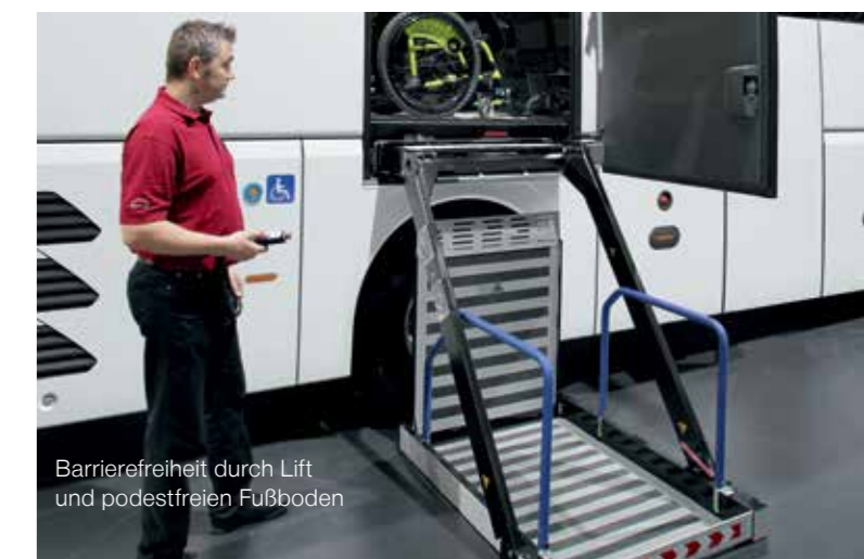
Barrierefreiheit durch Lift und podestfreien Fußboden