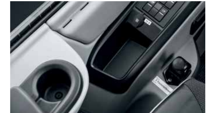
Großzügiges, praxisorientiertes Ablagekonzept

Der Lion's Coach empfängt seinen Fahrer mit einem praxisorientierten, ergonomisch eingerichteten und ansprechend gestalteten Arbeitsplatz. Das neue Armaturenbrett liefert alle wichtigen Informationen auf einen Blick und sorgt mit optimierter Schalteranordnung für erhöhte Bedienergonomie. Das gleiche gilt für das großzügige und praxisorientierte Ablage-Konzept inklusive Cupholder, das genügend Fläche für alle wichtigen Utensilien bietet. Für eine entspannte Arbeitsatmosphäre sorgen außerdem der ergonomische Sitz, das stufenlos verstellbare Multifunktionslenkrad sowie die individuelle Klimatisierung für den Fahrerbereich.