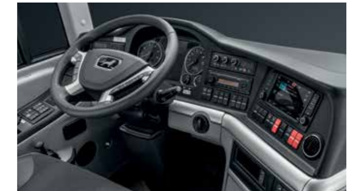
Optimal angeordnete Bedienelemente