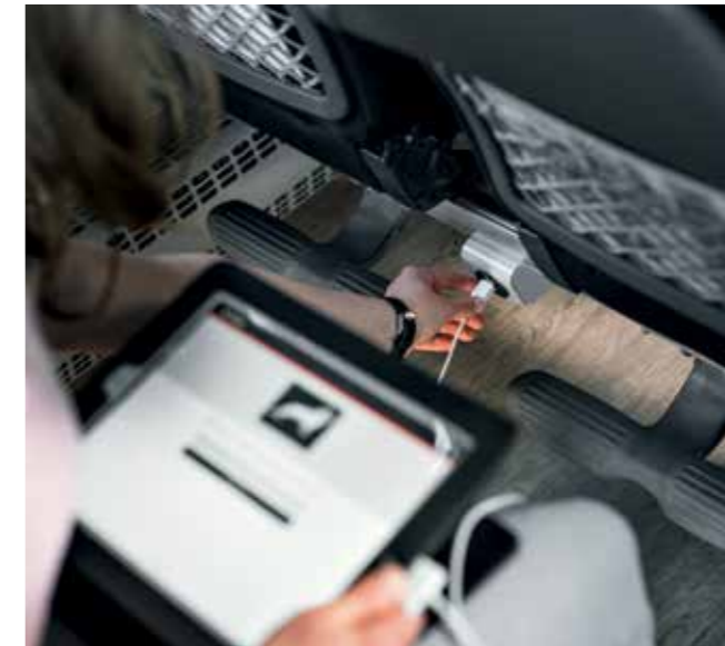
USB-Anschlüsse für jeden Fahrgast