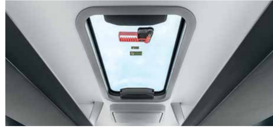
Großzügige lichtdurchlässige, getönte Glasdachluken