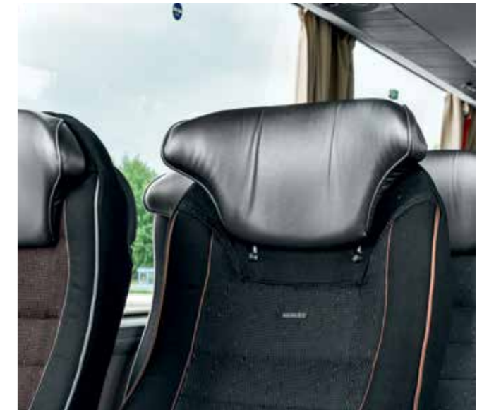
Verstellbare Kopfstützen für hohen Komfort