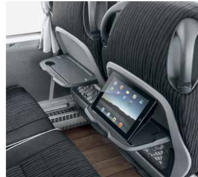
Komfortable Tablet-Halter an jedem Sitz

Typisch MAN: Wer im Lion's Coach Platz nimmt, kommt in puncto Komfort vollends auf seine Kosten. Die neuen großzügigen Glasdachluken werfen den Innenraum mit mehr Licht und Helligkeit deutlich auf und schützen gleichzeitig mit hoher UV-Filterung vor zu viel Sonneneinstrahlung. Die Sitzplätze sind mit allem ausgestattet, was sich das Fahrgastherz heutzutage wünscht. Attraktive Ausstattungen wie unser Infotainmentsystem MAN Multimedia Coach, Tablet-Halter, USB-Anschluss oder verstellbare Kopfstützen sorgen für ein komfortables und individuell gestaltbares Reiseerlebnis. Im MAN Lion's Coach reist man einfach vorbildlich.