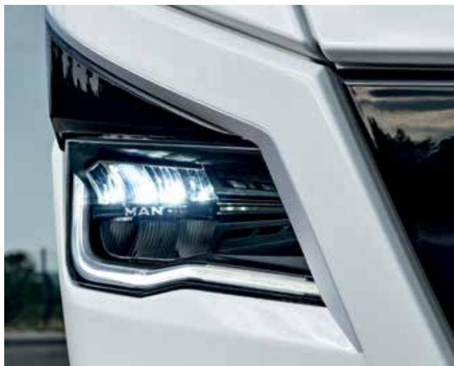
Effizienter und sicherer: Voll-LED-Hauptscheinwerfer (optional)