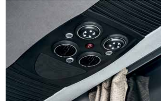
Bedienfreundliche Service-Sets für entspanntes Reisen