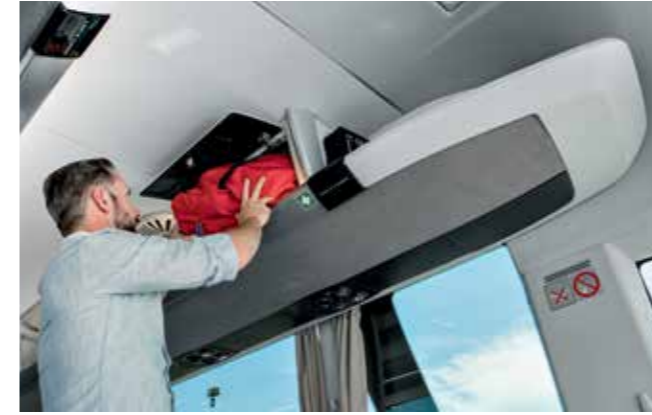
Formschöne Gepäckablagen fördern das Raumgefühl