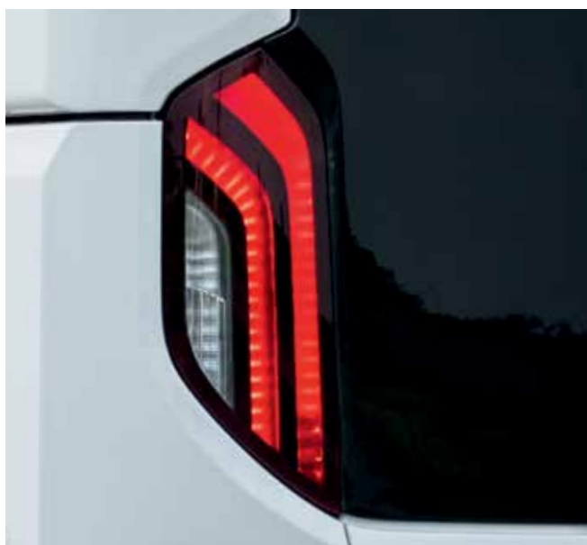
Optisch und technisch top: Voll-LED-Rückleuchten