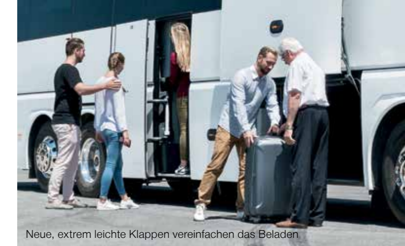
Neue, extrem leichte Klappen vereinfachen das Beladen