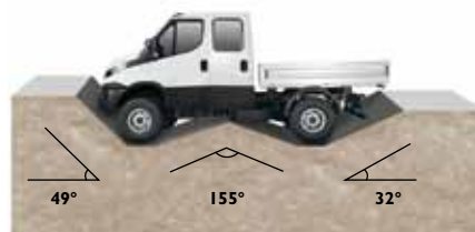
Böschungswinkel vorne Rampenwinkel Böschungswinkel hinten