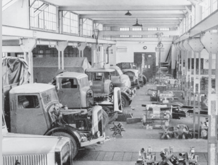
HINTERE BAHNHOFSTRASSE, AARAU